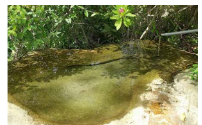
きれいになった水面