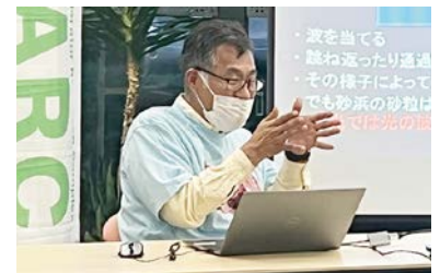
小林隆 J-PARC センター長

ハローサイエンスの動画はJ-PARCホームページにあります。 http://j-parc.jp/c/public-relations/movies.html#Hello-science