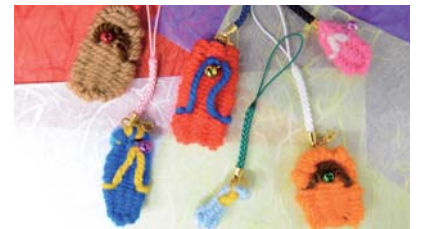
わらじストラップ

J-PARC センターでは、T2K 実験コラボレーションミーティングの開催に合わせて、海外の研究者に日本の伝統文化に触れてもらう各種体験教室を行っています。今回は、毛糸を使ってわらじを編んでストラップを作るもので、海外からのコラボレーターを含む 15 名ほどが参加しました。参加者は 2 色の毛糸を選び、スタッフの指導を受けながら、1 時間ほどでわらじストラップを完成させました。