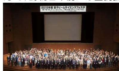
量子ビームサイエンスフェスタ/MLFシンポジウム/PFシンポジウムの参加者

KEK 物質構造科学研究所とMLFによる合同サイエンスフェスタは、今年度から名称を「量子ビームサイエンスフェスタ」に変更し、約570名の参加者を迎えて開催されました。初日午前には基調講演及び来賓挨拶が行われ、午後はポスターセッション、及び5つの研究分野ごとのパラレルセッションにおいて利用実験による成果発表が行われました。二日目のPF(KEK放射光科学研究施設)シンポジウムと平行で開催されたMLFシンポジウムでは、施設側の取り組みや研究成果が発表されました。渡邊昇先生と西山樟生先生の追悼セッションでは今日のMLFを実現させた両先生の業績や人となりを振り返り、さらにMLF特別セッションでは、量子ビーム科学と計算科学との融合による新しい研究の方向性について活発な議論が行われました。