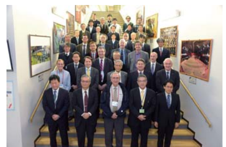
IAC委員と会議参加者の集合写真

J-PARCの施設や運営などについて、国内外の専門家を招聘して国際的視点でレビューを行う各種アドバイザリー委員会が標記期間中に開催されました。ミュオン科学実験施設、加速器施設に関わる委員会および中性子アドバイザリー委員会(NAC)が開かれ、NACでは、22日に開催した、中性子標的容器設計の妥当性評価のための国際レビュー委員会の審議結果が報告されました。J-PARC全体のレビューを行うIACでは、J-PARC関係者から施設の現状や将来計画などについて、また、各委員会からは審議結果が報告され、議論が行われました。IACからは、これまでの実績を今後のサイエンスの成果によりいっそう結びつけるようにとの御意見を頂きました。