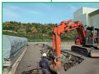
ニュートリノミュオンモニター棟。震災時に液状化現象で陥没した個所の修復作業を実施。