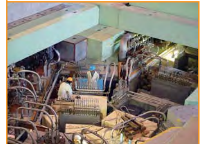
同上施設のビームライン電磁石、電源配線、冷却水管などについて、健全性の確認が進められている。