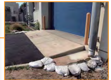
ハドロン実験施設では、トレーラー出入口周辺の陥没修復を実施し、重量物の輸送手段の確保がされた。