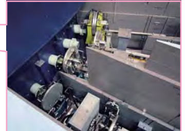
BL18~20中性子ビームラインでは、遮蔽体を移動して装置の健全性を確認。