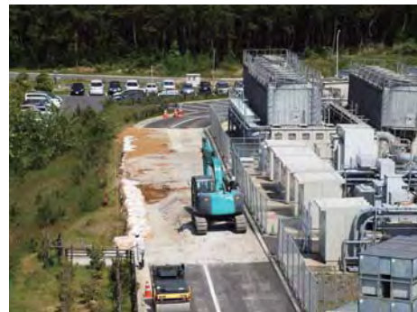
3GeVシンクロトロンでは、周回道路を仮復旧し、受電設備復旧に向けた準備を進めている。

※復旧計画については http://j-parc.jp/ja/topics/2011/ja.html に掲載（5/20）