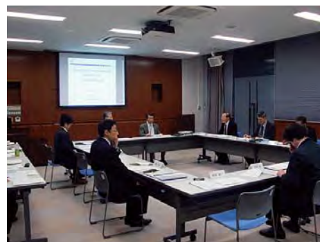
第1回 連携協力会議開催（4/26）

J-PARC物質・生命科学実験施設の共用促進法に基づく利用促進業務を行う機関として、3月22日にCROSS（一般財団法人総合科学研究機構）が文科省から選定され、4月1日にJAEA・KEK・CROSSの間で、連携協力協定を締結した。また、4月26日には第1回連携協力会議がいはらき量子ビーム研究センターで開催され、事業計画やユーズオフィス業務の連携、情報システム利用など、連携協力に関する検討状況報告が行われた。