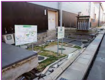
リニアック棟周りでは、給排水設備配管が多数寸断された。修復に向けて準備中。