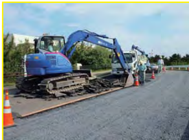
加速器トンネルを乗越える道路。一部陥没したが大型トレーラーなどの通行に支障が生じないように最優先で復旧させた。