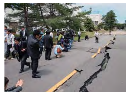
被害状況をプレス関係者に公開(4/28)