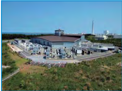
3GeVシンクロトロン屋外では、周回道路、電源ヤード、給水ラインなどの修復工事に着手。

震災から2カ月が過ぎ、加速器や実験装置の点検並びに水準測量による傾斜測定など、詳細な被災状況の把握を進めている。また、施設の復旧も開始され、道路の復旧、受電設備や給排水設備などの修復工事が進められている。