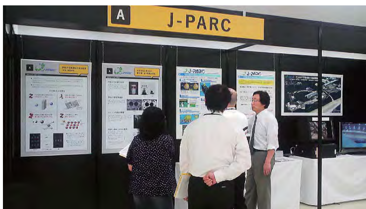
日産自動車TCで開催の茨城県内企業のイベントに出展したJ-PARCブース

茨城県内企業が有する先端技術を広くアピールするため、常陽銀行主催、いはらき成長産業振興協議会共催の「技術提案型展示商談会 in NISSAN」が、神奈川県の日産自動車テクニカルセンターで開催された。J-PARCも中性子の産業利用を中心に展示を行い、X線との比較などを判りやすく説明した。展示会に参加した多数の技術者・研究者から質問が寄せられた。